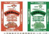
大豆酵素低温有機発酵肥料(1号・2号)

大国酵素肥料は幾種類もの有機物原料で構成され土壌中に多くの微生物が集まり、その微生物が出す酵素が、たんぱく質や炭水化物をアミノ酸や糖に分解し団粒構造の土壌を生み出します。チッ素・リン酸・カリウムやその他の微量要素も含まれており、植物の成長に必要な自然環境の条件を整えることが出来ます。 大国酵素肥料を施し地力がアップした圃場は殺虫剤による土壌殺菌をしなくても、根コブ線虫や連作障害を防ぎ、ミミズなど小動物の沢山いる自然環境の整った良質の土壌が出来上がります。